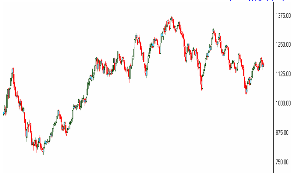
Γενικός Δείκτης (ημερήσιο)

Ο ΓΔ επανήλθε χαμηλότερα των 1,170 μονάδων, καταγράφοντας το χαμηλότερο τζίρο των τελευταίων οκτώ συνεδριάσεων. Τεχνικά, οι επόμενες στηρίξεις εντοπίζονται στις 1,150 και 1,138 μονάδες. Πλέον, η προσοχή της Αγοράς στρέφεται στο σημερινό Eurogroup, καθώς και στην έκθεση της αξιολόγησης της πιστοληπτικής ικανότητας της Ελλάδας σήμερα από τον οίκο S&P.